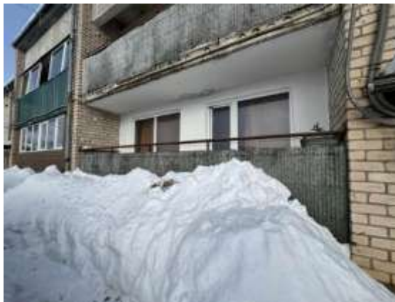
Dzīvokļa Nr.7 lodžija un logi uz pagalma pusi