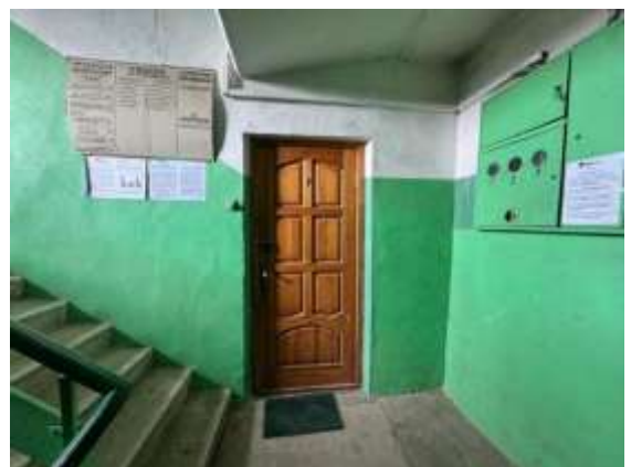
Dzīvokļa Nr.7 ieejas durvis