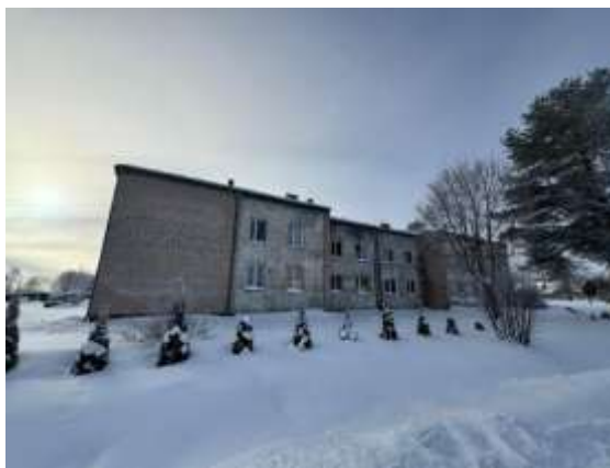
Dzīvojamā māja Domes ielā 19A