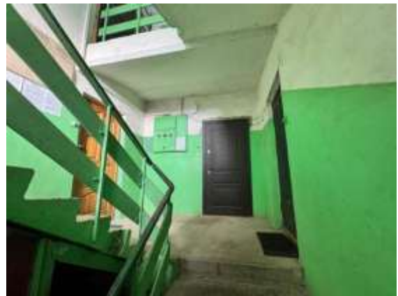
1.stāva kāpņu telpa