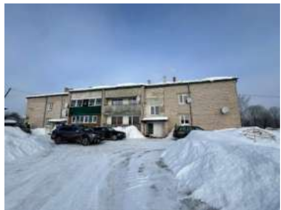
Dzīvojamā māja Domes ielā 19A