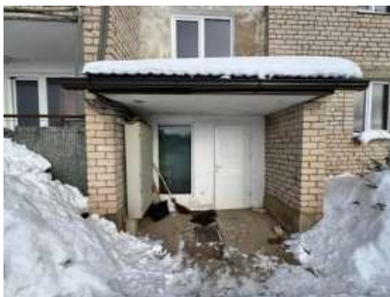
ieeja kāpņu telpā